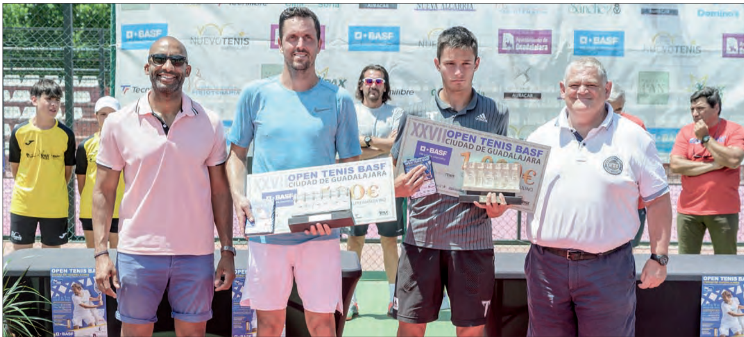
Ganador del Open de Tenis BASF Ibp Ciudad de Guadalajara en el año 2023.