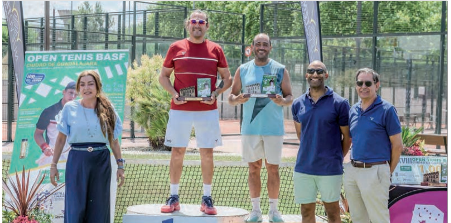
Ganador y finalista de la categoría de Veteranos +35.

Un año más, la categoría Veteranos +35 ofreció un buen tenis y dejó grandes puntos en las pistas de la Ciudad de la Raqueta de Guadalajara.