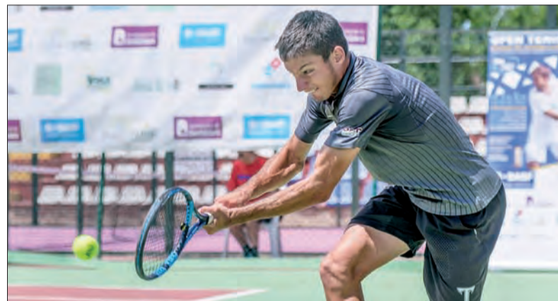
Finalista del Open de Tenis BASF Ibp Ciudad de Guadalajara el año pasado.