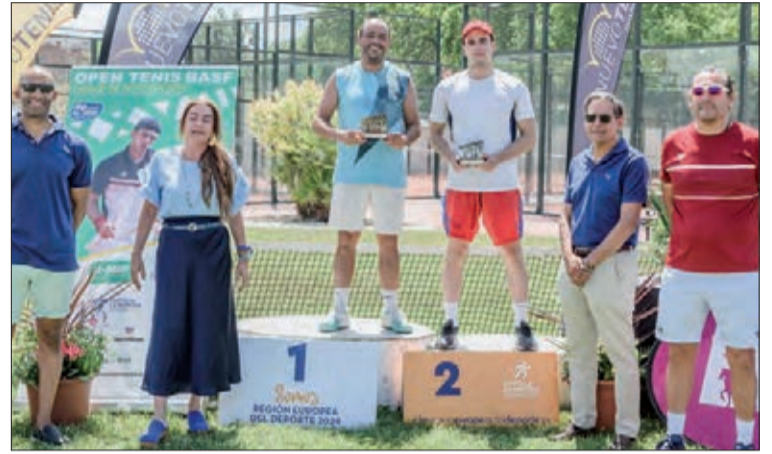
Ganador y finalista del cuadro final y del cuadro de consolación de la categoría Absoluto Social.