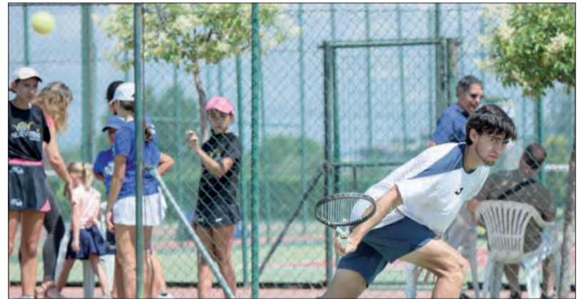
Ganador y subcampeón del XXVIII Open de Tenis BASF Ibp Ciudad de Guadalajara.