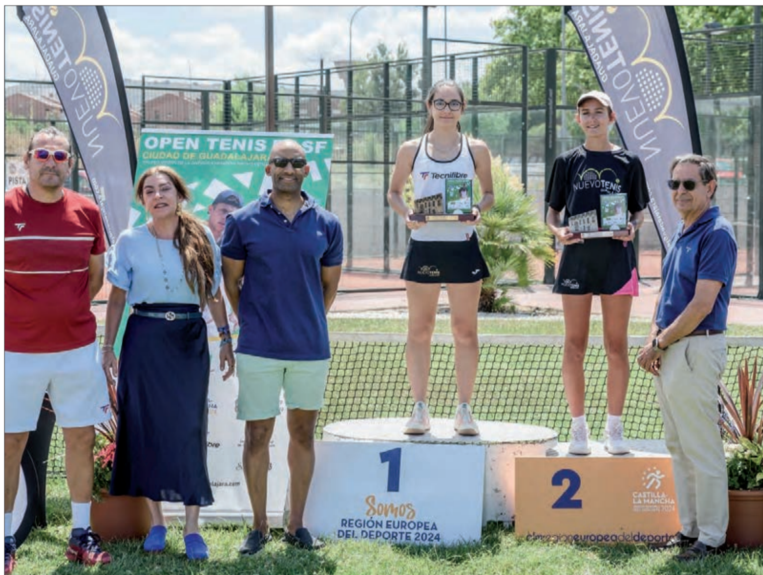
Ganadora y segunda clasificada de la categoría junior femenino.

Las cinco participantes en este cuadro demostraron que el tenis femenino está muy vivo en Guadalajara y que además, cuenta con jugadoras de gran nivel.