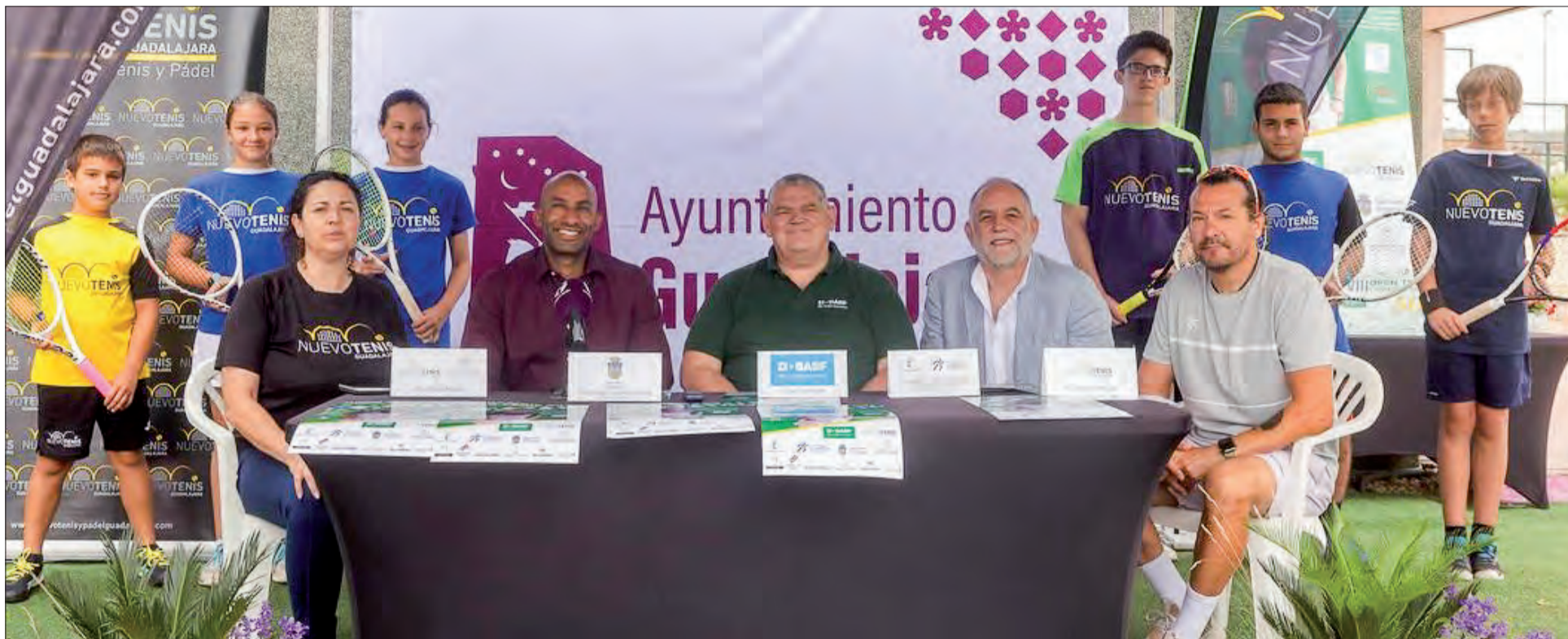
Imagen de la rueda de prensa de presentación de la XXVIII edición del Open de Tenis BASF Ciudad de Guadalajara celebrada en la Ciudad de la Raqueta.