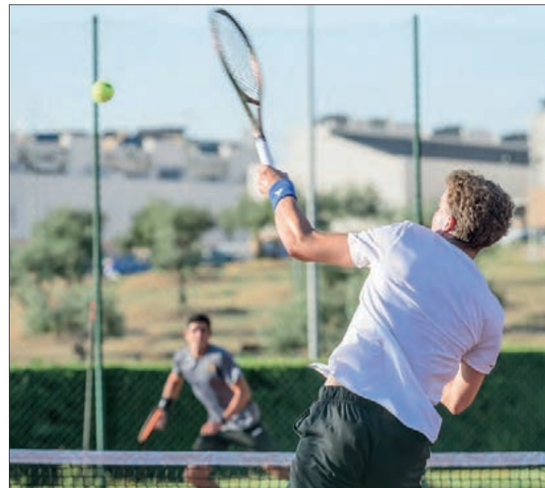
La fase previa ha sido una de las novedades de este año en el cuadro absoluto del torneo Ibp.