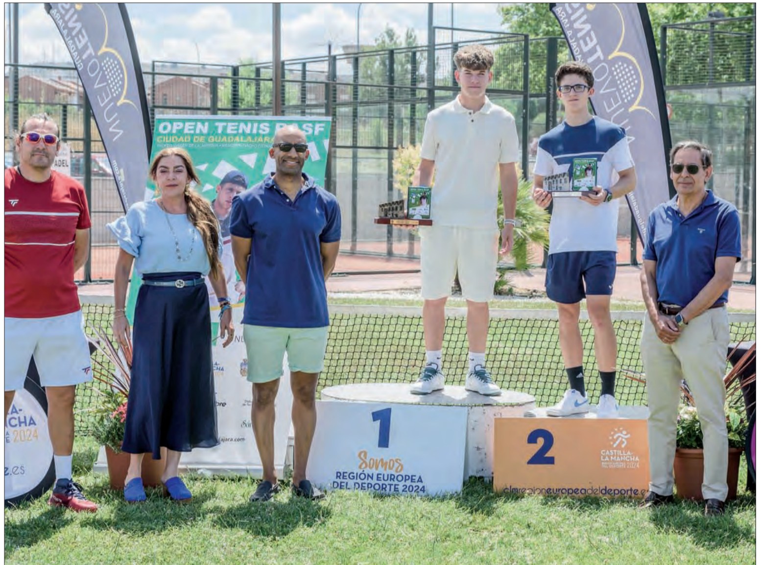
Campeón y segundo clasificado de la categoría junior masculino.